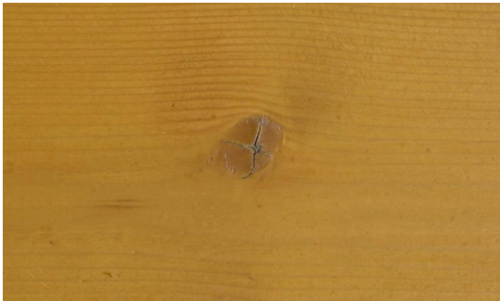
Grado di decomposizione 1