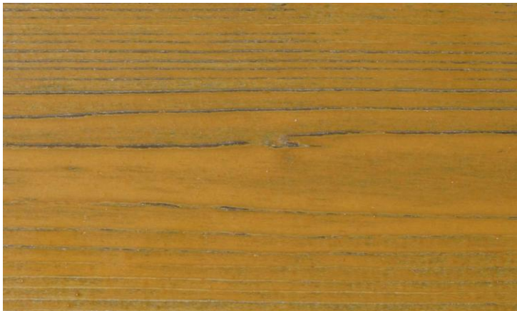
Grado di decomposizione 2