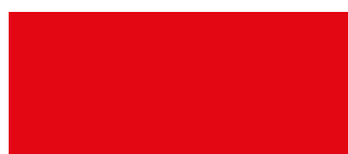
RAL 3020 Rosso traffico