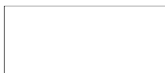
RAL 9016 Bianco traffico