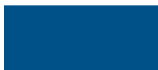
RAL 5010 Blu genziana