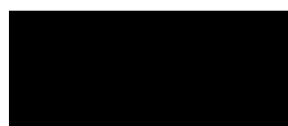
RAL 9005 Nero Profondo