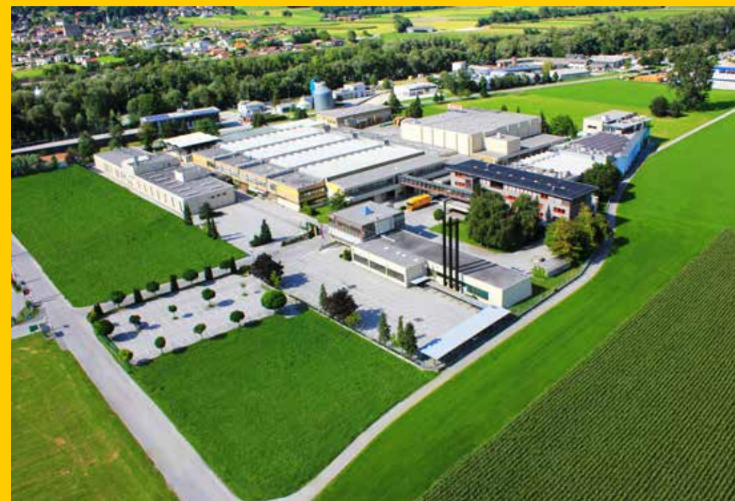
2017 La sede di ADLER-Werk a Schwaz, Tirolo