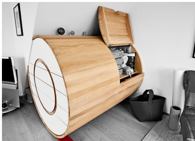
I falegnami hanno utilizzato ADLER Legno-Öl per la verniciatura della struttura.